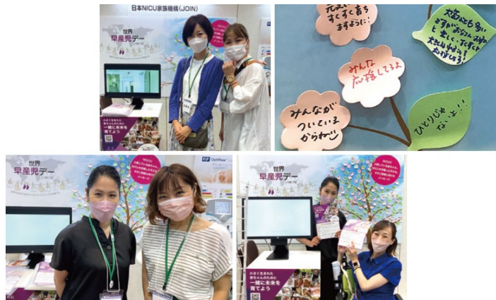
(NICU mate Vol.63)