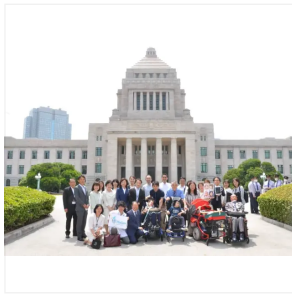
医療的ケア児支援法成立後、国会前に集まった関係者 = 2021年6月、東京都内

日常的に人工呼吸器やたんの吸引などが必要な子どもは「医療的ケア児」と呼ばれる。親はわが子に医療的ケアが必要だと知ったとき、どんな生活が待ち受けるか分からず途方に暮れ、日々の世話が生まれれば付きつきりとなる。そんな家族の相談を受け止め、支えるのが「医療的ケア児支援センター」だ。2023年度中に全都道府県で整備を終える見通しとなった。これまで大きかった地域間の支援格差を解消しようという動きも進む。医療的ケア児支援法が成立してから6月で2年。「どこに住んでいても支援を受けられる社会」は実現できるか。(共同通信 = 沢田和樹)