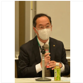
岐阜県飛騨市の都竹潤也市長 = 2022年11月、東京都内